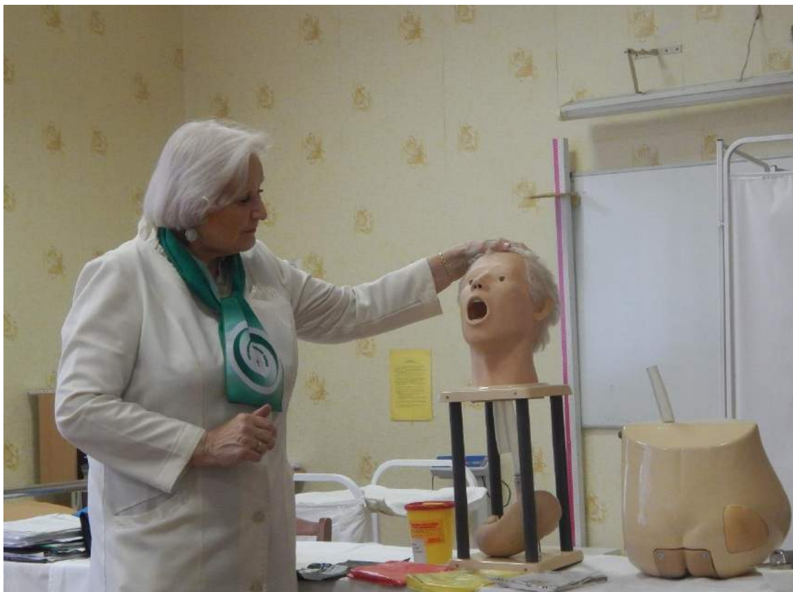
Кабинет доклиники ОСД

После экскурсии по Колледжу обучающиеся получили ответы на интересующие их вопросы. Каждый участник «Дня открытых дверей» получил информационные материалы по приемной кампании и памятные подарки.