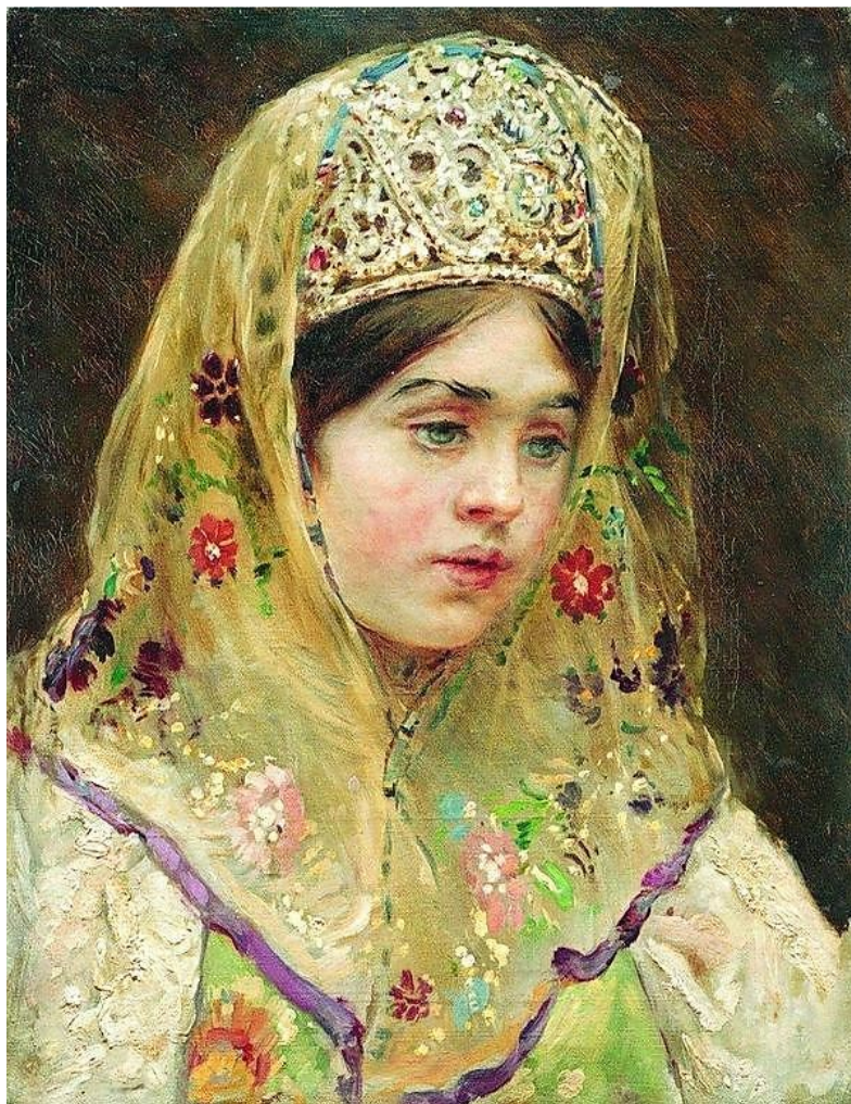
«Девушка в русском костюме» К.Е.Маковский