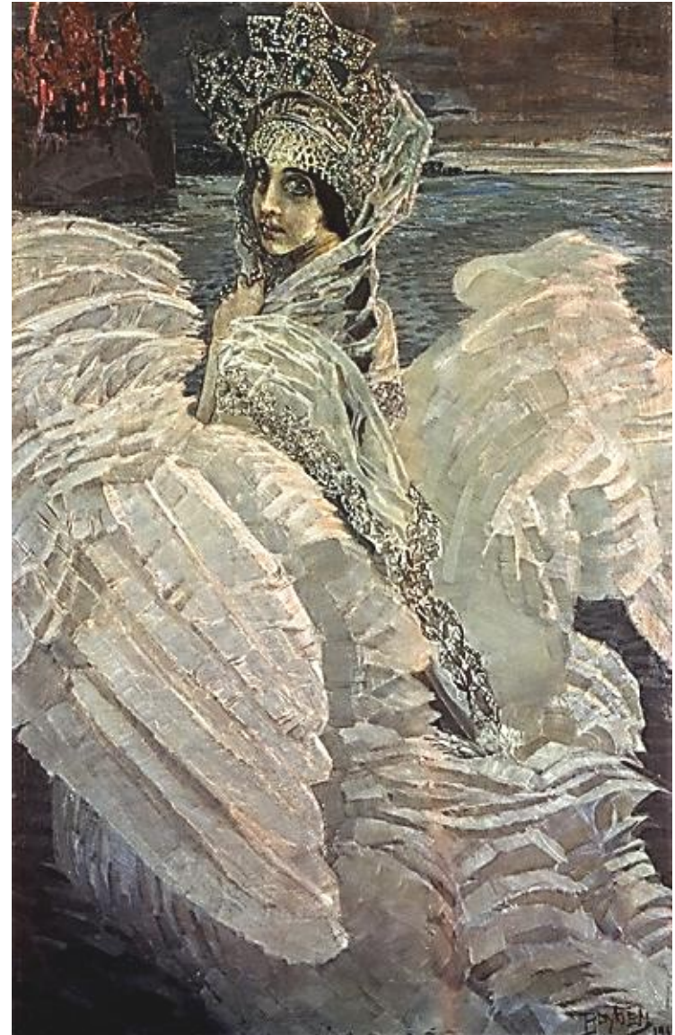
«Царевна-Лебедь» М. Врубель

Женский образ тесно связывали с образом птицы- счастья. В устном народном творчестве ее называли «лебедушка» , «павушка» , «пава»