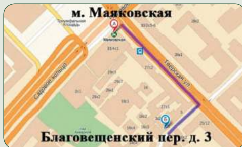
Прием документов м. Маяковская, Благовещенский пер., 3

Юридический адрес: 123001, г. Москва, ул. Б. Садовая, 14 Сайт Военного университета: www.vumo.mil.ru